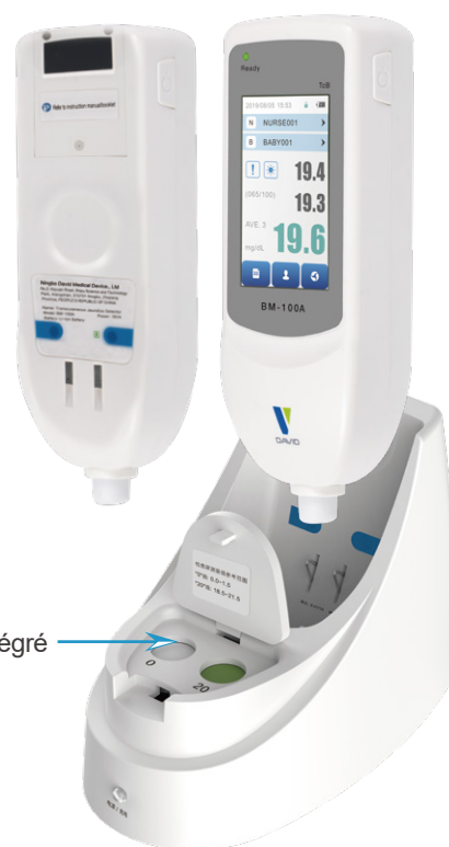
Panneau de contrôle intégré